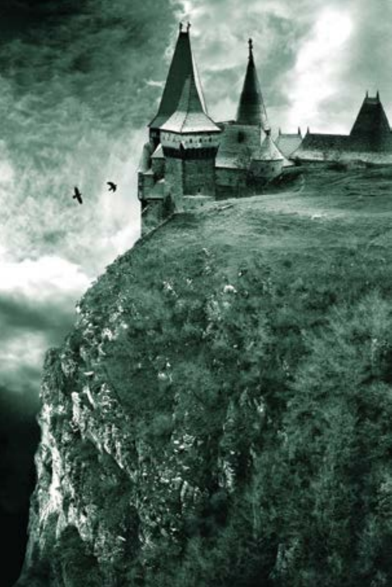
◀ Constantin Găină - Castelul Corvinilor