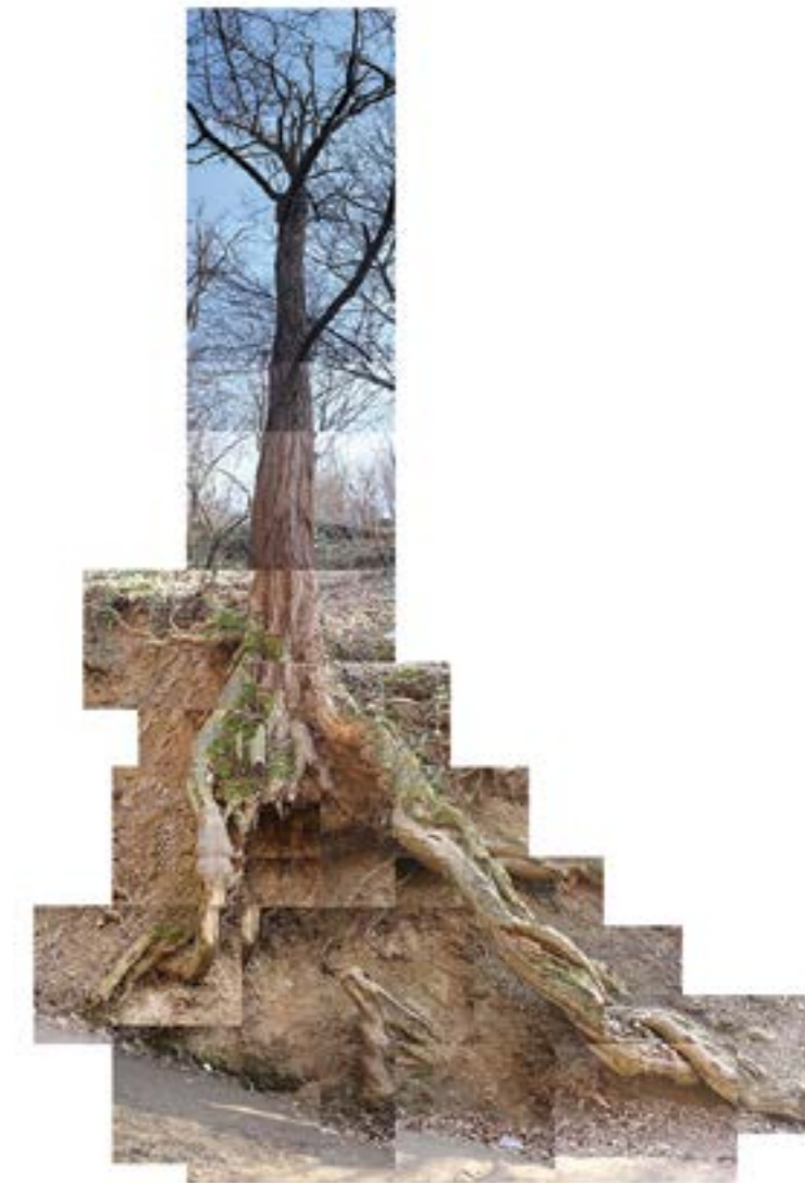
Adrian Coșarcă - Copacul (fotomontaj) ▶

Adrian Coșarcă abordează tehnica fotomontajului, un stil de lucru care dezvăluie afinitatea sa pentru rigoarea pe care, la începutul secolului al XX-lea, o propunea curentul cubist. Metoda de lucru vine ca o încercare de a se rupe de arta figurativă și modul de reprezentare bazat pe regulile perspectivei liniare, fără a distruge, însă, realismul imaginii fotografice.