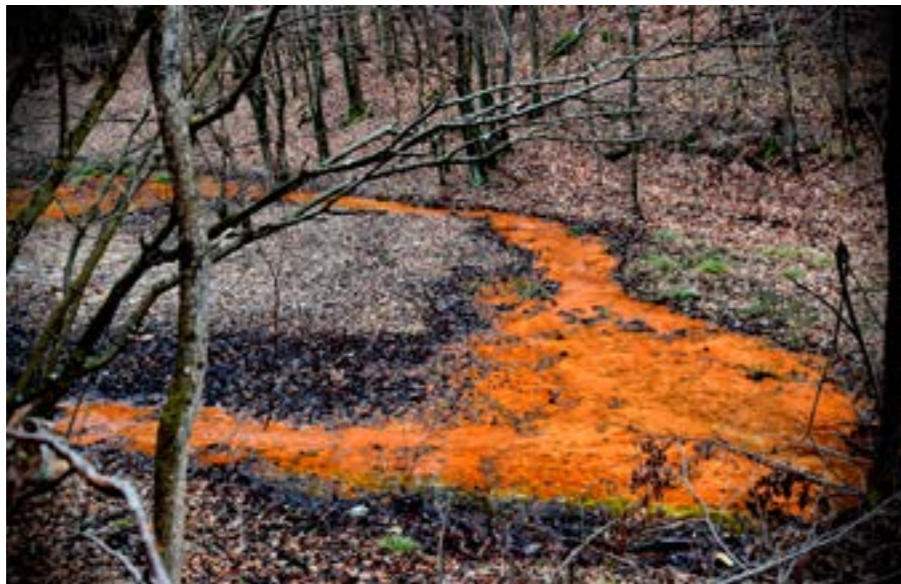
Daniel I. Iancu / ÎnSEMNE fotografice 10